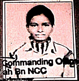
Offg Commanding Officer 17 Mah Bn NCC Ahmednagar